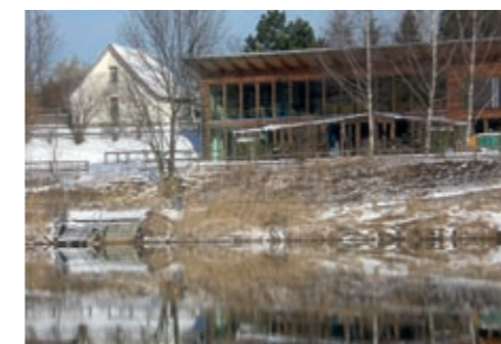
Das gemeindeeigene Gasthaus Bruggerhorn: wie können wir es für alle HöchsterInnen attraktiv machen?

Wenn wir Gelegenheit schaffen für den Austausch, das heißt mit den Bürgerinnen und Bürgern in Dialog treten, sie um ihre Meinung und ihre Ideen fragen, kann es uns gelingen, die Lebensqualität aller Höchsterinnen und Höchster zu verbessern.