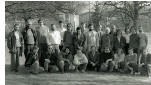
Die KandidatInnen der Gemeinde- vertretungswahl 1990

Aus einer Protestbewegung gegen den Ausbau des Flugfeldes Altenrhein und gegen die geplante S18 hat sich Ende der 80er Jahre der Verein „Höchste Zeit“ gebildet. Seither bestimmt „Höchste Zeit“ das Gemeinde-geschehen unübersehbar mit.